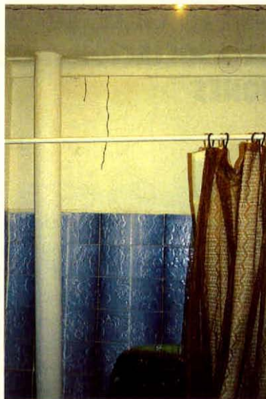
Tubo de comunicación de termitas subterráneas emergiendo desde cañerías de baño de una vivienda.

A diferencia de otros insectos que dañan la madera, las termitas no dejan rastros de aserrín y el daño no se presenta con orificios sobre la superficie de la madera. Para sobrevivir requiere de lugares oscuros, húmedos y tibios.