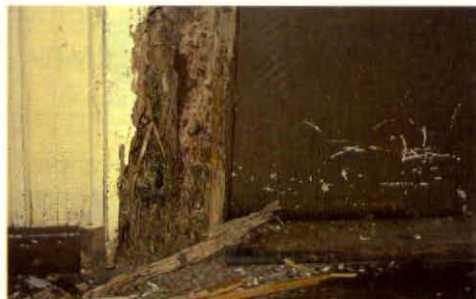
Daño producido por termitas subterráneas en marco de una puerta.