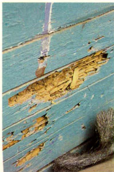
Daño producido por termitas subterráneas.