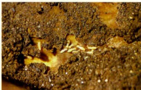
Vista general, termitas subterráneas en galerías en madera que estaba enterrada.

a las viviendas de las ciudades, causando muchas molestias a sus moradores. Si bien se alimentan de elementos que contienen celulosa, las termitas subterráneas pueden dañar otros materiales a fin de acceder a lugares de alimentación. Es así como se las ha encontrado perforando plástico, yeso y poliestireno, entre otros. Estas termitas se alimentan de papel, lino u otros elementos que contienen celulosa dentro de la casa a la que han ingresado. Es común observar sus típicos túneles de comunicación sobre muros y los enjambrazones de la casta de termitas aladas durante los meses de primavera.