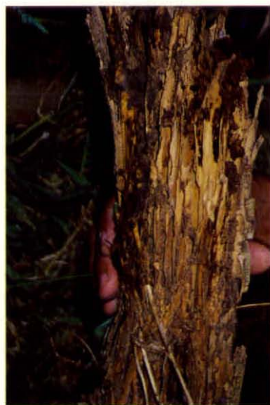
Daño generalizado en rollizo sin impregnar.

Los materiales, en los que se verificó ataque por alimentación de termitas, fueron: madera, tableros contrachapados, tableros de partículas, tableros de fibras, papel, cartón y lino. La presencia de daño causado por termitas es más notoria en elementos fuera de la construcción (madera en contacto directo con el suelo como cercos tocones, restos de raíces) de tipo no estructural.