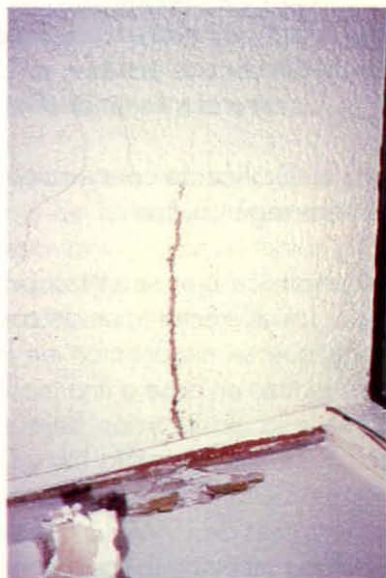
Daño en cornisa y entretecho con túnel emergiendo hacia abajo.

madera en contacto con el suelo y sin ningún tipo de protección, acceden a través de ellos al inmueble. Si existen goteos de agua, las termitas se favorecen, ya que prefieren las zonas húmedas, por lo que es usual observar sus túneles de comunicación emergiendo en baños y cocinas. La figura 1 muestra la tendencia de los tipos de construcción que ha atacado R. hesperus en Santiago (se refiere a las construcciones muestreadas durante la prospección: 102 puntos).