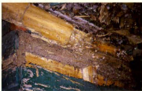
Paño en estructura en exterior.

decir, construcciones en madera en contacto directo con el suelo, alcanza un 4%.