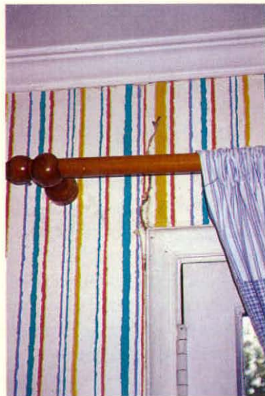
Túnel de comunicación saliendo de marco de puerta y daño en papel mural.

mento, los conocimientos técnicos que le permitan adecuar su actividad a los nuevos requerimientos que les exigen los mercados, en este sentido la termita subterránea es un factor que debe ser considerado tanto en el corto como en el largo plazo. Ello dará como resultado un aumento en la calidad de los productos disponibles a los consumidores, con los consecuentes beneficios comerciales para quienes poseen los negocios.