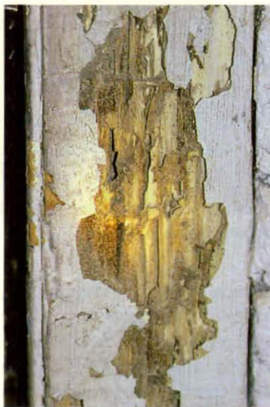
Daño producido por termitas subterráneas en el marco de una puerta.