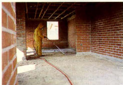
Formación de barrera química en preconstrucción (antes de instalación del radier).

El usuario común y corriente no puede usar directamente estos productos. Las razones son varias: los productos requieren de un manejo cuidadoso; la técnica de aplicación de los mismos es muy específica y requiere de equipamiento adecuado; y, finalmente, se debe realizar un tratamiento que entregue una barrera de gran duración en el tiempo y ambientalmente segura. Por ello, los termiticidas sólo deben ser aplicados por empresas profesionales autorizadas para el control de plagas como la termita.