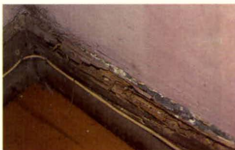
Daño de termitas subterráneas en moldura.

La especie más frecuentemente atacada fue pino insigne, lo cual también se asocia con el hecho de que ésta es la especie que se usa con mayor frecuencia como material de construcción, además, corresponde a una madera "blanda" una de las preferidas por las termitas.