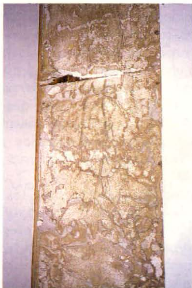
Daño en plancha de yeso-cartón.

Estudios realizados en Europa han demostrado que el hombre, al habitar una casa de madera versus una vivienda de otros materiales, logra en el primer caso que las condiciones ambientales mejoren sus condiciones, tanto psicológicas como biológicas.