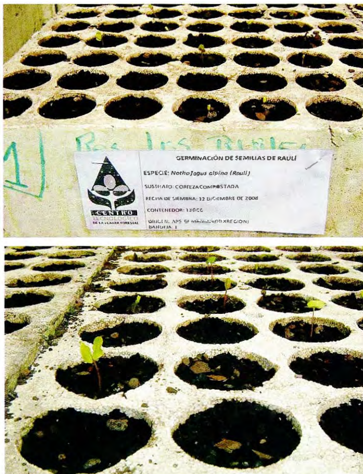
Proceso de germinación de semillas de Raulí (INFOR-CTPF, 2008)

Cabe mencionar que, previo a la siembra se tomaron tres muestras de 500 semillas cada una y se remojaron en agua a temperatura ambiente por 24 horas. Este ensayo se realizó con la finalidad de conocer el porcentaje de semillas potencialmente viables y precisar aún más el número de semillas factibles de germinar. Estos resultados indican que las semillas recolectas presentan un porcentaje de viabilidad de un 42,1%, en un rango que oscila entre el 40,4 y 43,2%.