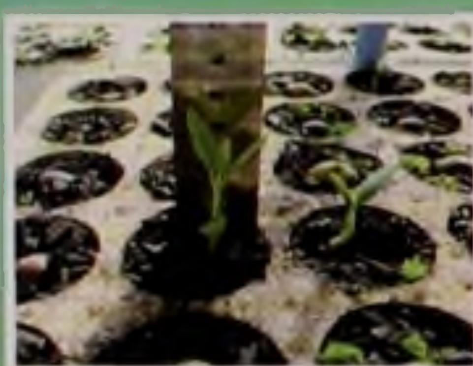
Proceso de germinación de Pitao (a) a los 27 días y (b) 96 días desde la fecha de siembra (INFOR-CTPF, 2008)