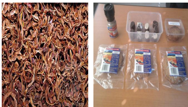
Figura 3 Semillas y productos de acacia.

Izquierda: Vainas y semillas. Derecha: Productos alimentarios de la industria "bush food" comercializados en Australia. Saborizantes, chocolates y galletones a partir del procesamiento de semillas de Acacia spp.